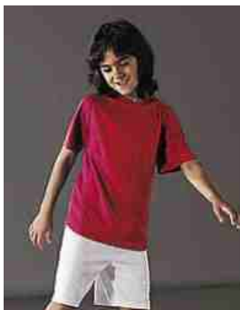
DWT shirt: € 11,30