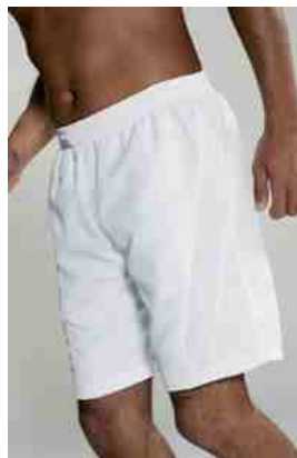
DWT short: € 8,50 zonder € 16,95 met zakken

Laatste kans voor de prijsverhoging om je DWT clubkleding te kopen! (vanaf 1 januari 2014 verhogen de prijzen i.v.m. de 21% BTW)