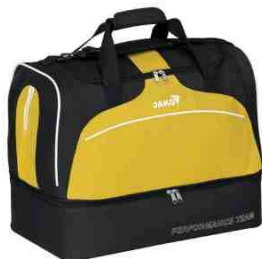
DWT tas: € 26,75