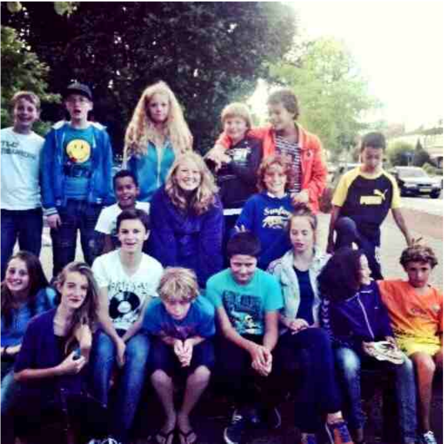
Patat gegeten en nog even een fotootje!