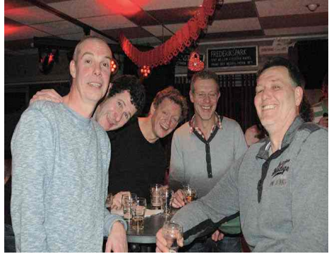
Heren 3: Trotse winnaars van de pubquiz 2014

Deze avond werd mede mogelijk gemaakt door dames 1 die er trouwens gevleugeld bij liepen deze avond. Geheel thema liefde gebonden waren zij de Cupidoteresses van de avond: "Dames 1 geeft je vleugels". Ook hebben zij voor de fantastische aankleding van het clubhuis gezorgd en de avond voorzien van lekkernijen. Na de quiz konden de voetjes nog los van de vloer en zorgde DJ KES voor de muziek. We hopen volgend jaar weer op een super pubquiz en nu we dan toch zo lekker in de spelletjes sfeer zitten: een spelletje. De overgebleven letters vormen nog een woord.