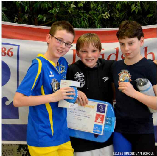
Kenan 100m wissel 3e

DWT kan terug kijken op een mooi weekend waar weer veel geleerd is en waar we het huiswerk mee hebben gekregen voor de volgende periode om zo weer eind juni te gaan vlammen in Dordrecht.