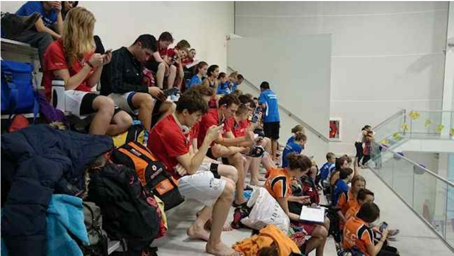
Haagse Goud cup.