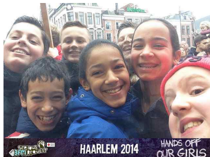
DWT bij het glazen huis