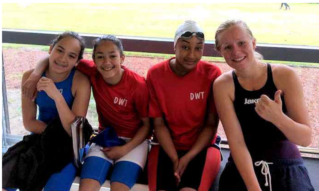
Zomer Kring (zie pagina 6).

De Waterdruppels is het officiële tijdschrift van de Haarlemse zwemvereniging 'De Watertrappers' (DWT) en verschijnt tien keer per jaar.