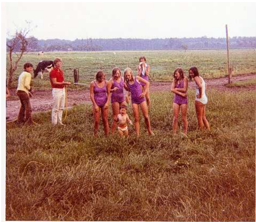
1969 - Zomerkamp

Er werd met algemene stemmen besloten voortaan de kleur PAARS in te voeren voor badpakken en zwembroeken.