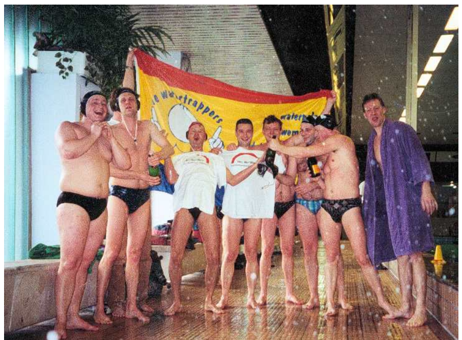
2000 - Heren 2 Kampioen

een replica van de paarse badjassen die heren 1 in de jaren 80 van de vorige eeuw had aangeschaft op initiatief van Siem